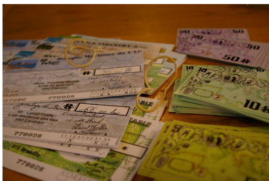
Des chèques, espèces et tickets manipulables